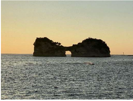
円月島に沈む夕陽は「和歌山県の夕日100選」に選ばれています