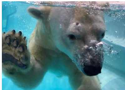
間近で見るシロクマは大迫力!!