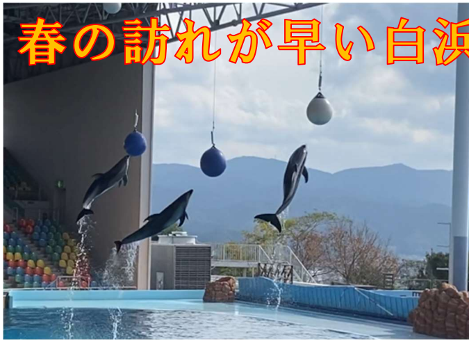
ダイナミックなイルカショーもご覧になれます