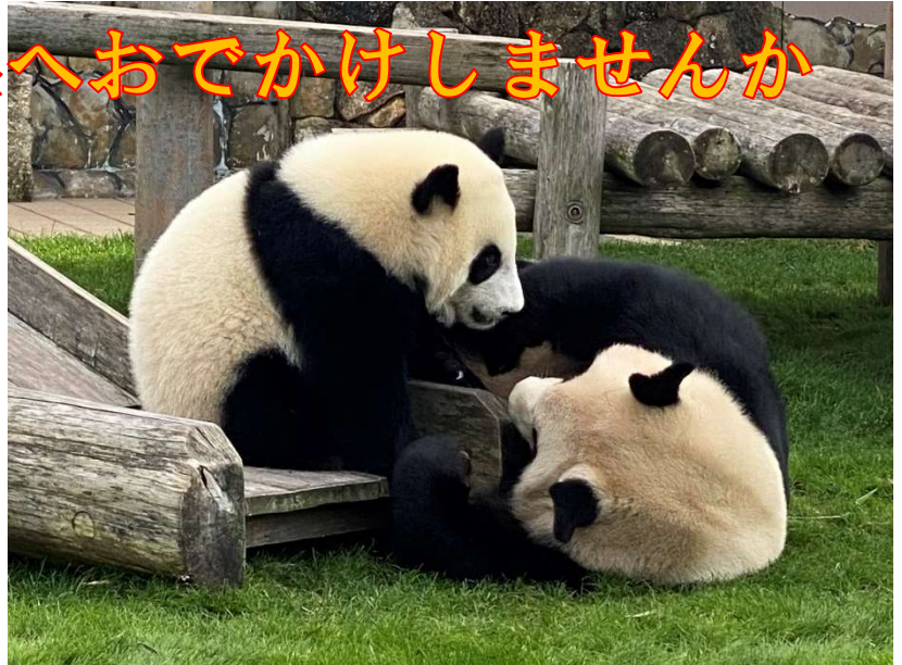
仲良くじゃれ合うパンダの赤ちゃん「楓浜」とお母さんの「良浜」