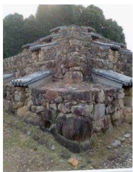
奈良のピラミッド「頭塔」 奈良市高畑町にあります

先日、奈良でピラミッドを見たケンタローで「頭塔」というらしいですね。地域の人たちが管理されておりまして。ここら辺も冬は地面が凍って滑りやすくなるだろうと思いつながら、施設の中でも滑って転倒する事故があるなど派生してしまいました。 そういう訳で今回のテーマは『転倒』です。まず『サニールタスの水で転倒しケガスパーマーケットに賠償がNHK事件記者取材note』を検索してみてください。概要は、滑ってけがをしたから二十万円を支払え、というものです。とても怖い話ですが、これはスパーだけの記事ではありません。どこでも起こりうる事案です。