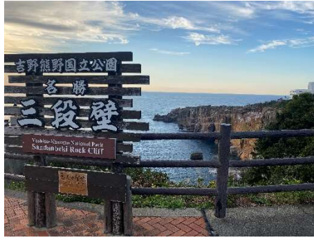
高さ60mの大岩壁が2km続く三段壁