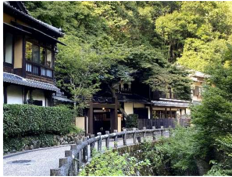
大正浪漫溢れる音羽山荘