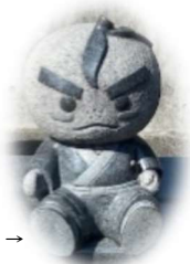
箕面市キャラクター「滝ノ道ゆずる君」→