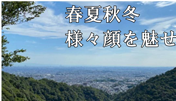
望海展望台から箕面と大阪市内を一望できます