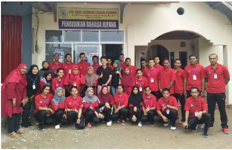
インドネシアで日本の介護を志す若者たち