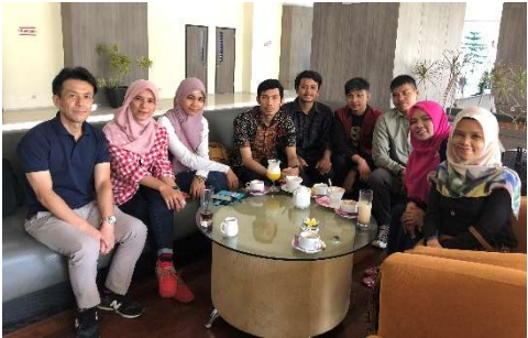
インドネシアで介護留学の説明をする筆者