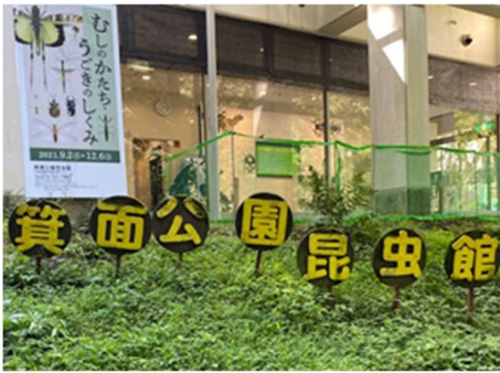
珍しい昆虫に出会える箕面公園昆虫館